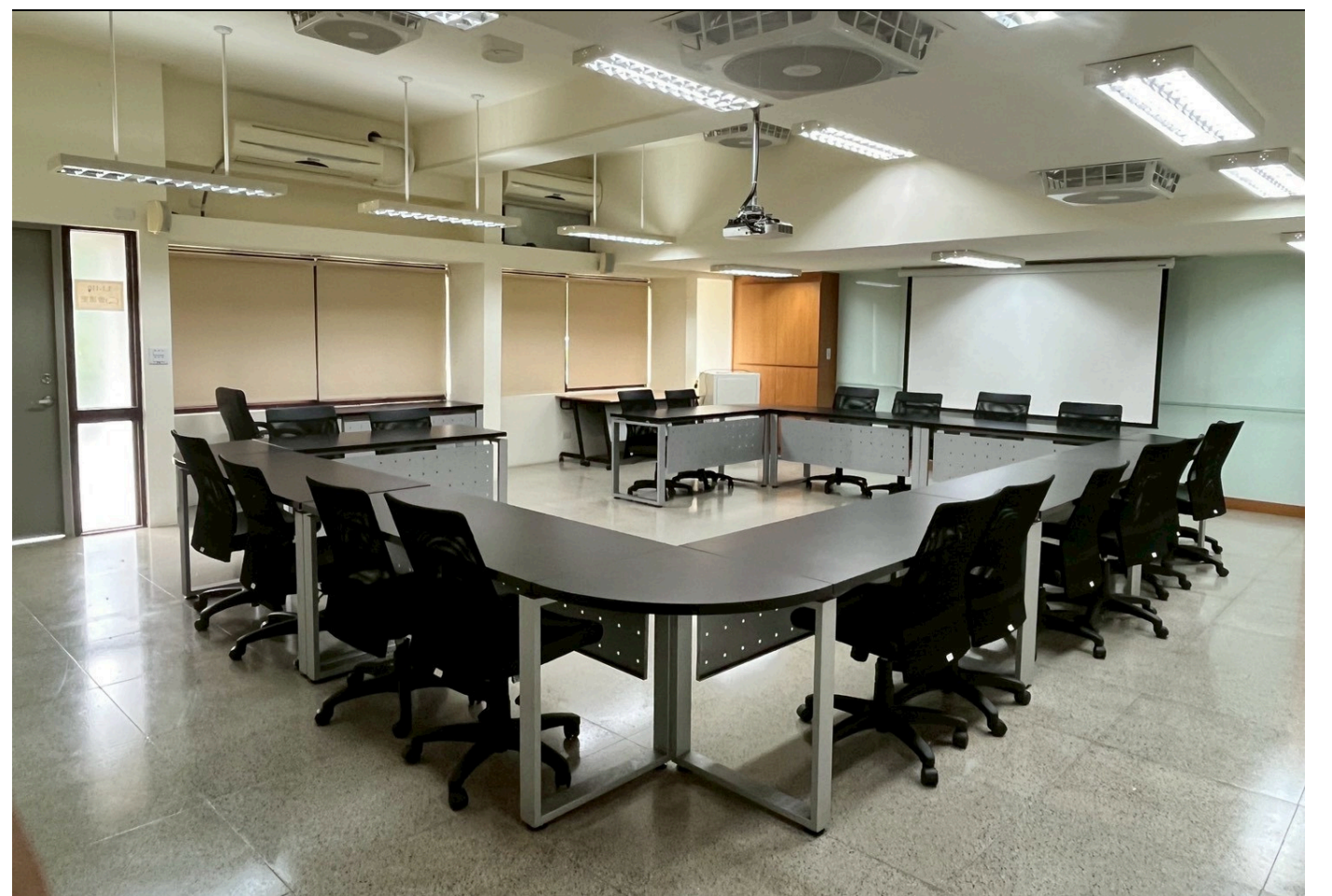
右後側往前拍攝圖