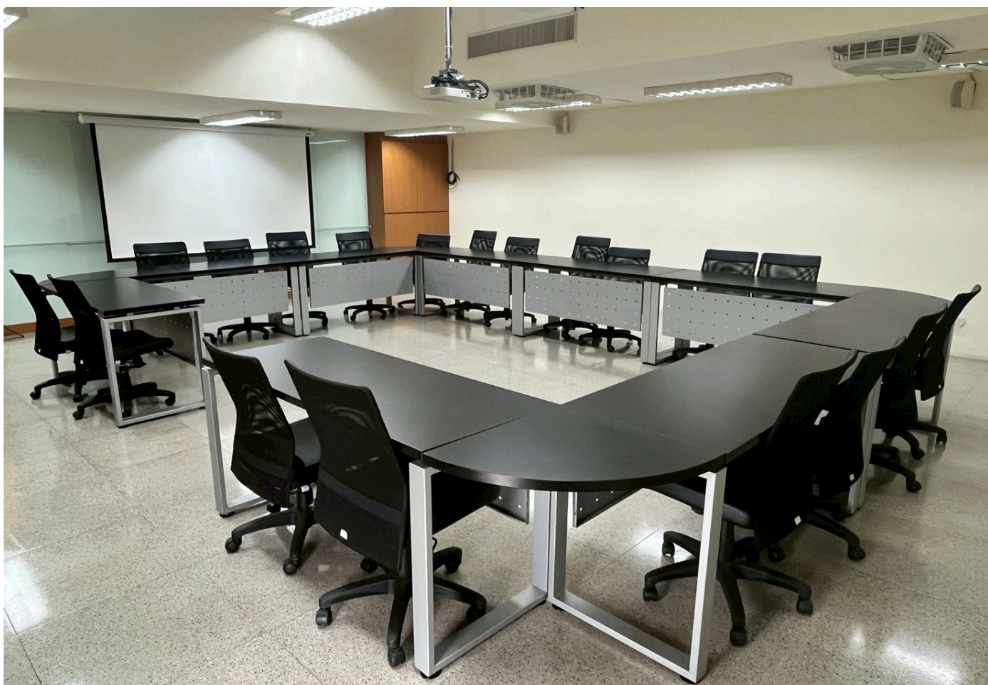
左後側往前拍攝圖