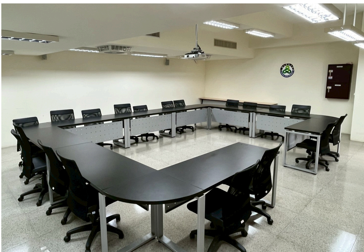
左前側往後拍攝圖