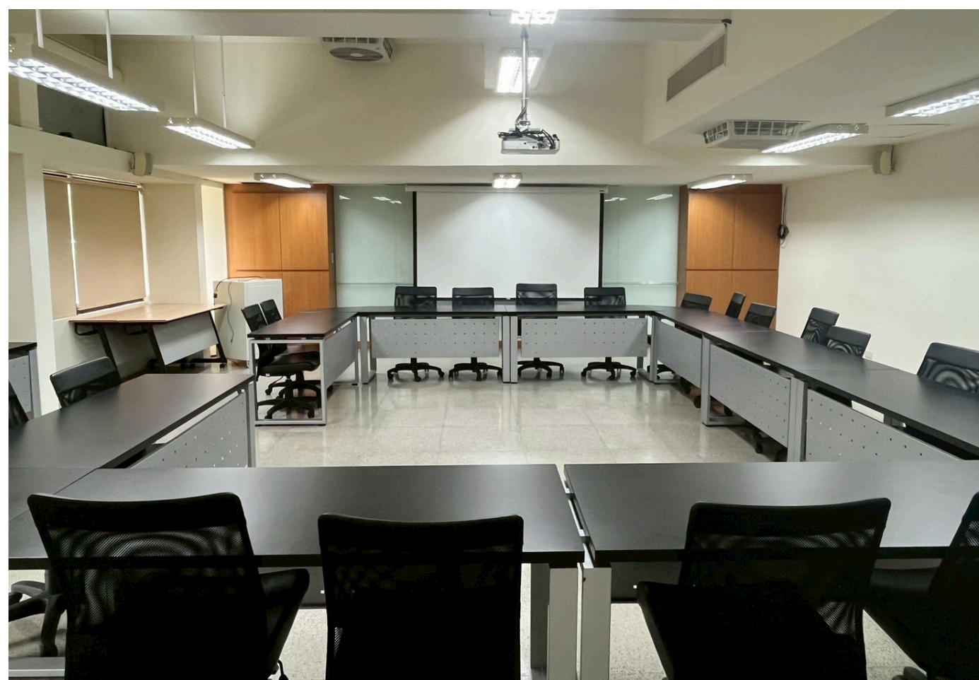
投影幕開啟後情形