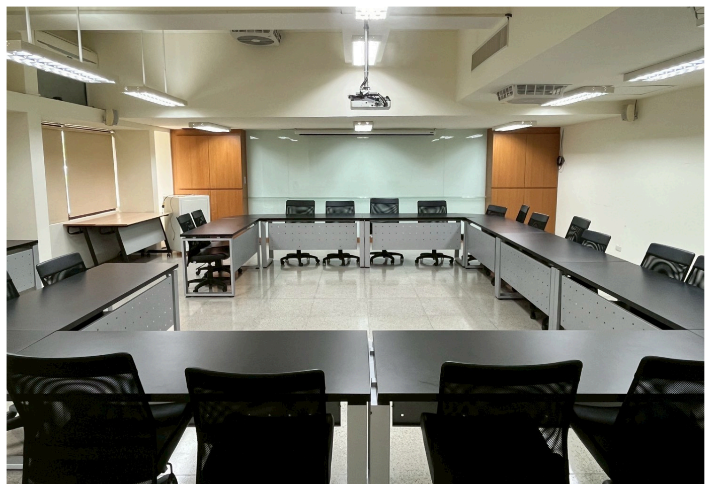
正後方向前拍攝圖